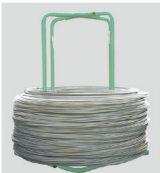
製品：リバーウェル

PHC・PRC パイル用高強度らせん筋 コピタ型 PRC パイル用高強度らせん筋