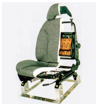
自動車シートばね

自動車用、シャッター用、家具等の各種スプリング及び、ワッシャー用、コントロールケーブル用等