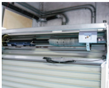
シャッターコイルばね