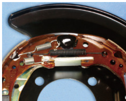
ドラムブレーキ・リターンスプリング