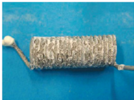
亜鉛めっき (48時間後)