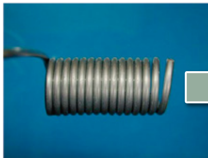
三価クロメート (48時間後)